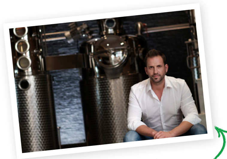
Whiskydestillerie Peter Affenzeller