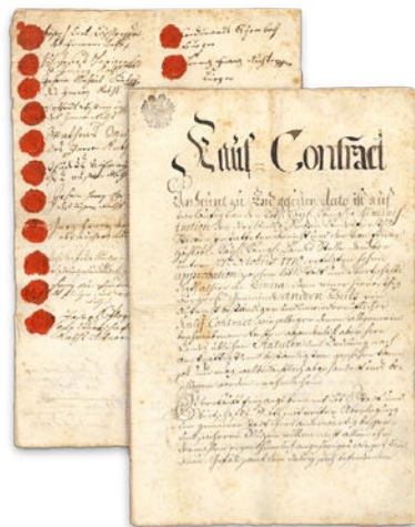
Freistädter Gründungsurkunde aus dem Jahr 1770.

Freistadt und das Bier sind seit der Gründung von Freistadt untrennbar miteinander verbunden. Mit der Meilenrechtsurkunde 1363 wurde der Grundstein der Braustadt Freistadt gelegt. Damit verlieh Herzog Rudolph IV. den Freistädter Bürgern das Recht, in ihren eigenen Häusern Bier zu brauen und auch auszuschenken.